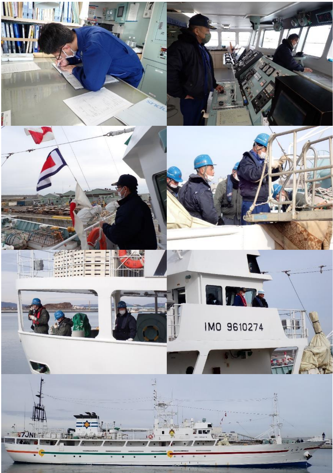
1月7日、全ての準備を終えて神海丸は石巻ドックを出港しました。これから島根へ向かいます。 いよいよ、第2次遠洋まぐろ漁業実習が始まります!!