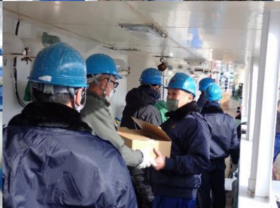
食料品の積み込み