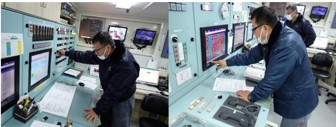
機関部点検作業の様子

船内で使用する飲料水や居室の居住環境など衛生管理が行き届いているか、航海の度に検査を受けています。