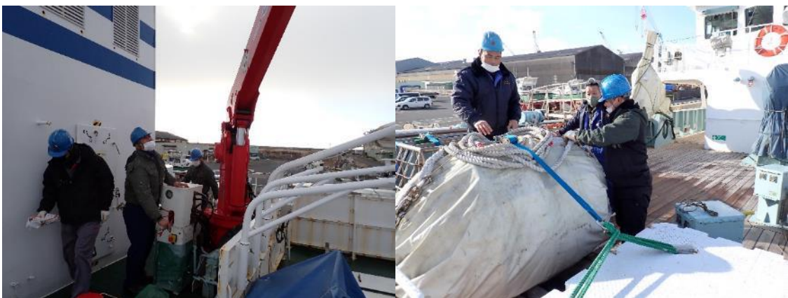
小型クレーンの点検