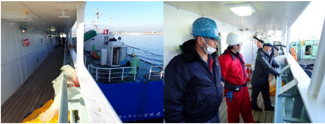
燃料油の積み込み

航海で使用する燃料油を積み込みました。少しでも漏れることがないように、機関部を中心に慎重に給油作業を行いました。