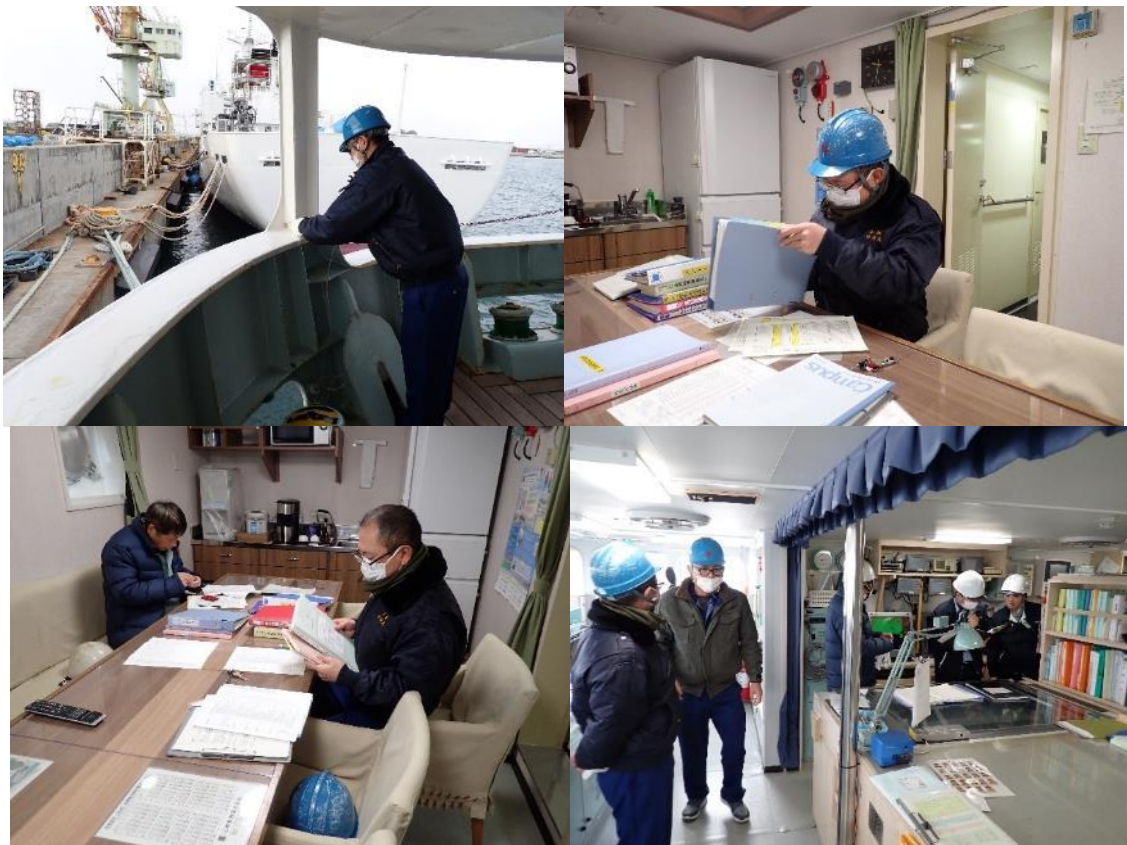
衛生検査の準備及び検査の様子

船内で使用する飲料水や居室の居住環境など衛生管理が行き届いているか、航海の度に検査を受けています。