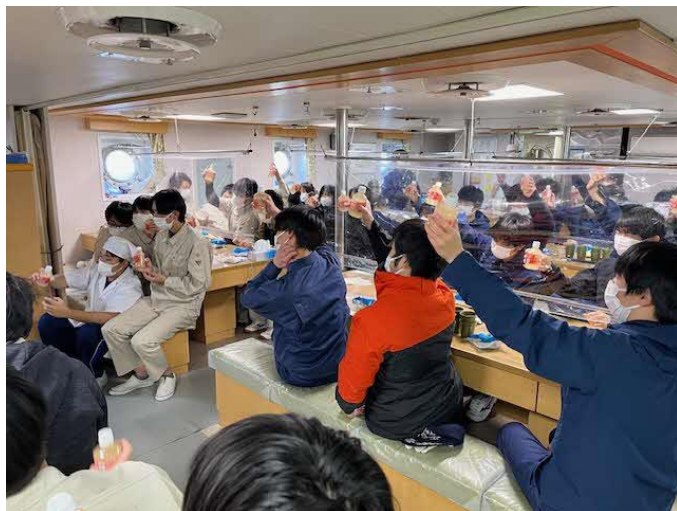
ジュースで乾杯しシュークリームをぱくり！食欲旺盛ですね～