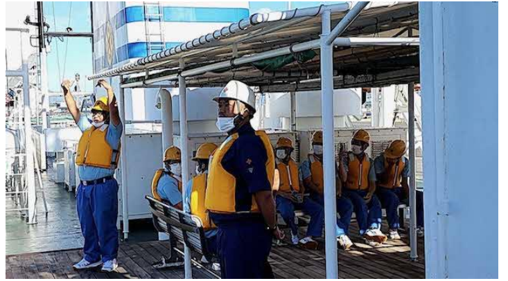
パイロットボートも準備OK