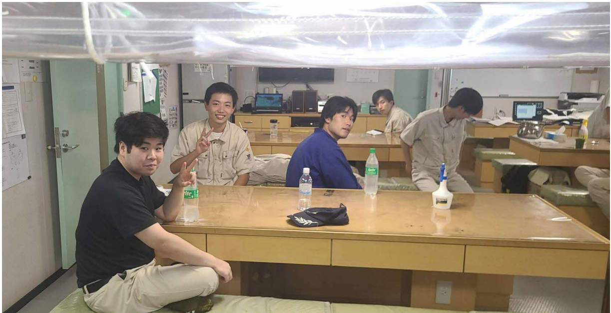
船内でくつろぐ専攻科生です！