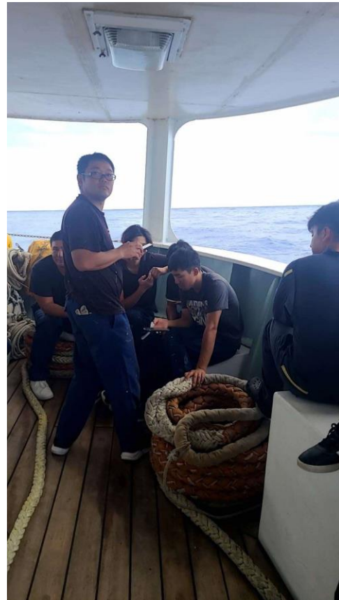
圏内に入りました！ 実習生・・・乗組員もスマホを 持ってデッキへ！