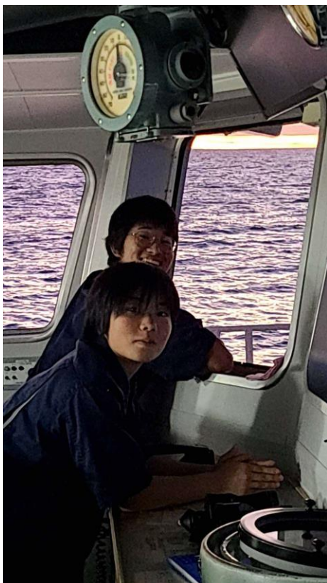
日本との時差は-19時（5時間進ん でいます）