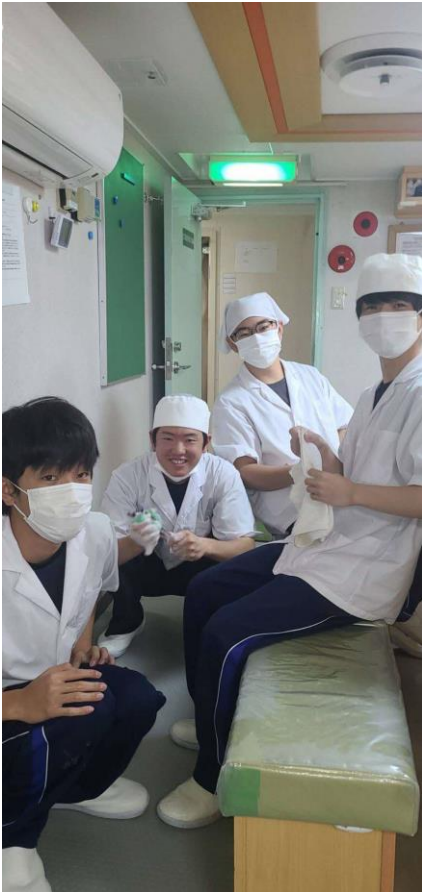
食事当番の生徒ですね！